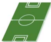
Ein Fußballfeld (0,75 Hektar) Energiepflanzen